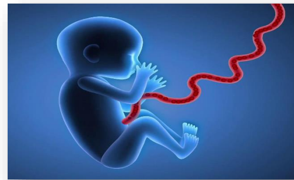
Programa de donació altruista de sang de cordó umbilical

Considerem important que tots els professionals puguin tenir accés a tot el circuit de treball i això els donarà seguretat, coneixements i excel·lència en la seva feina.